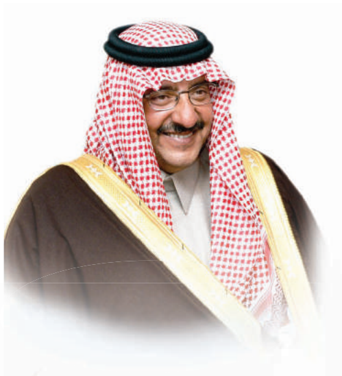
صاحب السمو الملكي الأمير محمد بن نايف بن عبدالعزيز آل سعود ولي ولي العهد النائب الثاني لرئيس مجلس الوزراء ووزير الداخلية