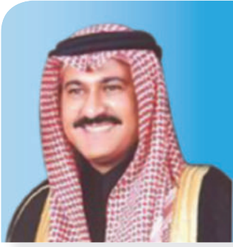
سمو الأمير خالد بن محمد بن عبدالعزیز بن ترکی