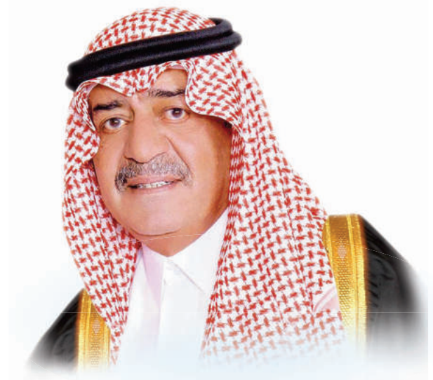
صاحب السمو الملكي الأمير مقرن بن عبدالعزيز آل سعود ولي العهد نائب رئيس مجلس الوزراء