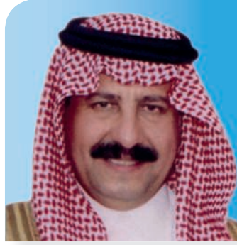
سمو الأمير سلطان بن محمد بن سعود الكبير نائب الرئيس والعضو المنتدب