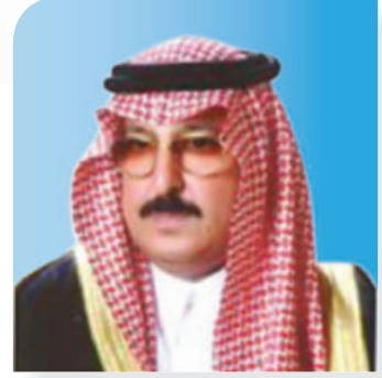
سمو الأمير تركي بن محمد بن عبدالعزیز بن ترکی رئيس مجلس الإدارة